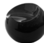
Black Glossy Nero Lucido