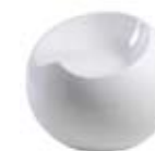
White Glossy Bianco Lucido

Elio is available in the standard colours of white gloss and black gloss.